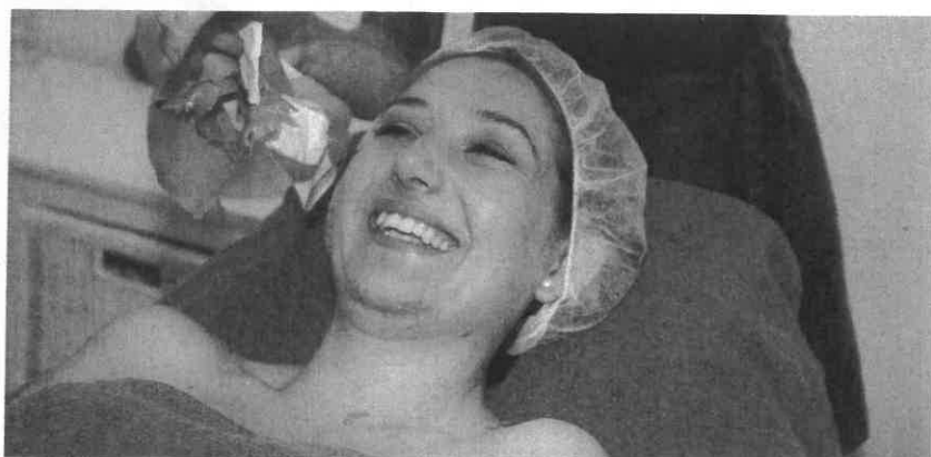
Die Kundin strahlt nach der Behandlung.

Produktkategorien besteht in der EU ein Ausschließlichkeitsverhältnis. Nutricosmetics werden deshalb fast ausschließlich als Lebensmittel in den Verkehr gebracht. Diese Entscheidung wird meist in einer Einzelfallbewertung, bei der alle Merkmale des Produkts berücksichtigt werden, getroffen. Und zwar in Abhängigkeit davon, welche Wirkweise überwiegt. Da der Lebensmittelbegriff keine spezifische Zweckbestimmung voraussetzt, spricht im Falle Nutricosmetics nichts gegen eine Zuordnung zum Lebensmittelbereich. „Nutricosmetics“ bzw. „Beauty Food“ sind also Lebensmittel, ggf. in Form von Nahrungsergänzungsmitteln, die mit Aussagen beworben werden, die dem Produkt eine kosmetische Zweckbestimmung zuweisen. Neben der Ge-